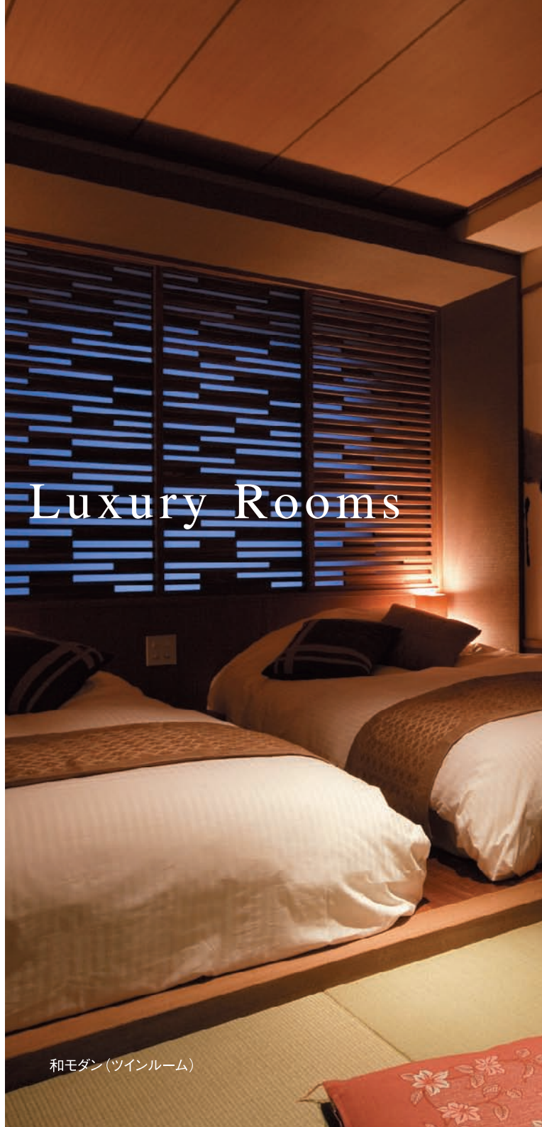
和モダン (ツインルーム)