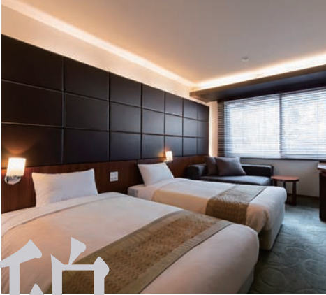
洋モダン (ツインルーム)