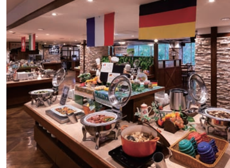
レストラン「ル・マッターホルン」